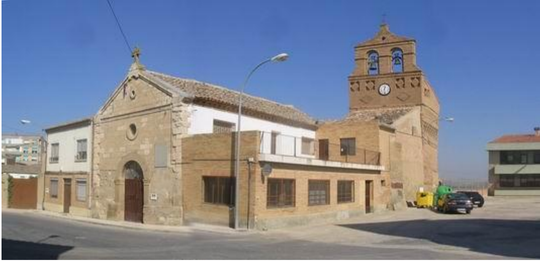
Iglesia de San Blas (Ribaforada, Navarra)