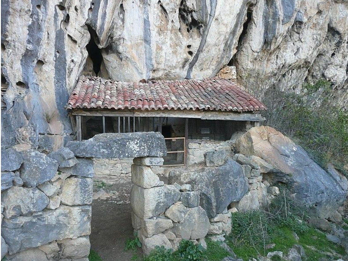
Iglesia rupestre de San Juan de Socueva (municipio de Arredondo, Cantabria)