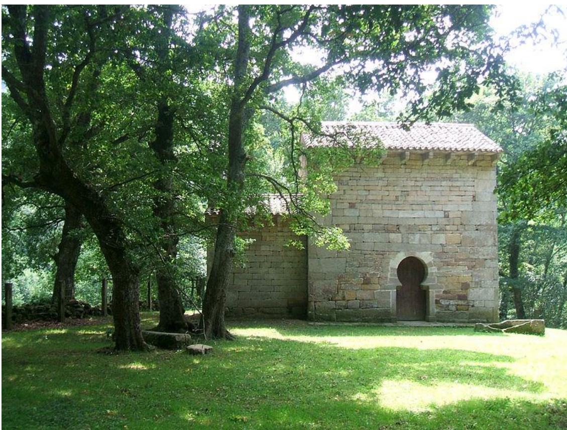
Ermita de San Román de Moroso (Bostronizo, Cantabria)