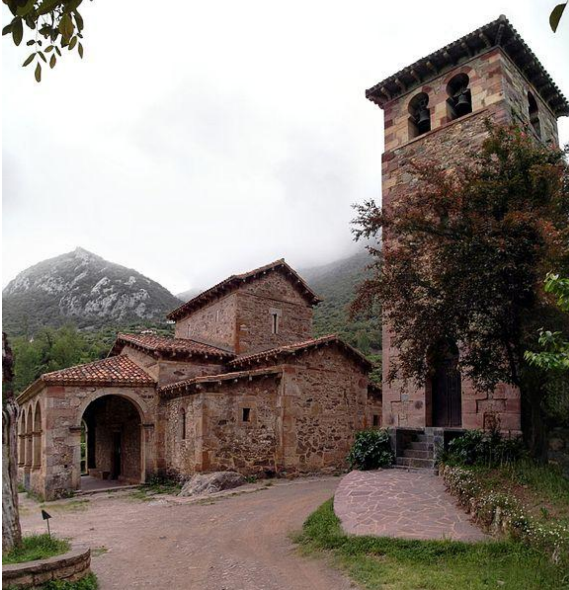
Iglesia de Santa María de Lebeña (municipio de Cillorigo de Liébana, Cantabria)