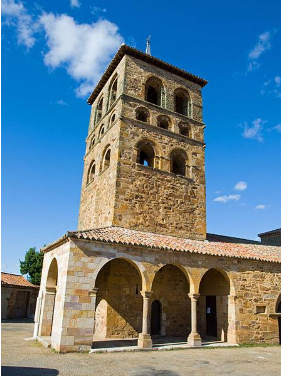
Monasterio de San Salvador de Tábara (provincia de Zamora) – Torre románica de la iglesia levantada sobre la primitiva mozárabe de San Salvador de Tábara