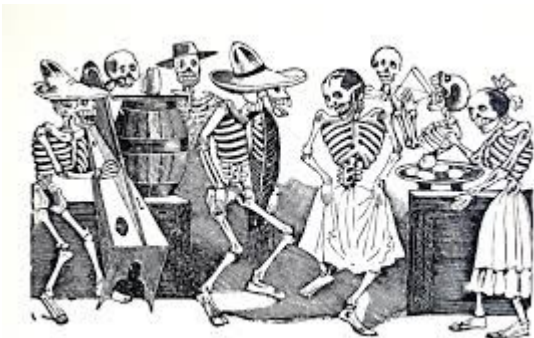
El jarabe en ultratumba